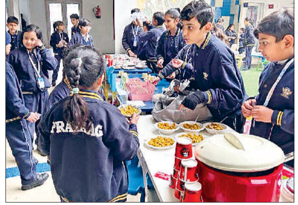
पानीपत। प्रयाग इंटरनेशनल स्कूल में फली मार्किट का दृश्य।

प्रयाग इंटरनेशनल स्कूल के विद्यार्थियों द्वारा फली मार्किट लगाई गई। पांचवीं, छठी व सातवीं कक्षाओं के विद्यार्थियों ने बूढ़-बूढ़ कर हिस्सा लिया। इस मार्किट में विद्यार्थियों का उत्साह देखते ही बन रहा था। इस मार्किट में विद्यार्थियों ने उपयोगी वस्तुएं व घर पर बनाए ट्यजनों को बेचा। यह बाजार बहुत ही अद्भुत था। इसमें बच्चों ने कुछ गेम्स स्टॉल भी लगाए। विद्यार्थियों