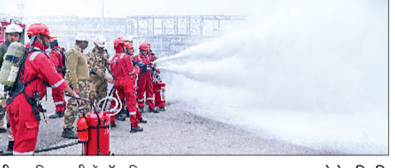
पानीपत। रिफाइनरी में मॉक ड्रिल का दृश्य।