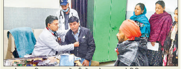
कुरुक्षेत्र। नागरिक अस्पताल में मरीजों का चेकअप करते चिकित्सक।