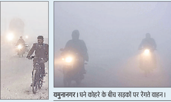
यमुनानगर। घने कोहरे के बीच सड़कों पर रंगते वाहन।

कुरुक्षेत्र। जिले में सर्द हवाओं के साथ धुंध के प्रकोप ने जनजीवन अस्त व्यस्त कर दिया है। सुबह और देर रात को धुंध की चादर बिछने से सड़कों पर वाहन चालकों का आगे बढ़ना मुश्किल हो चुका है। शुक्रवार सुबह के समय धुंध के बीच महज एक से दो मीटर की दृश्यता से लोगों को काफी परेशानी हुई। सुबह के समय सड़की मंडी में खरीदारी करने या अन्य जरूरी कार्यों से घरों के बाहर निकले लोगों को सर्द हवाओं के साथ धुंध से दो चार होना पड़ा। इससे उनकी दिनचर्या प्रभावित हुई। जानकारी के अनुसार जिले में न्यूनतम तापमान 7 डिग्री सेल्सियस के करीब जा पहुंचा है। अधिकतम तापमान 19 डिग्री सेल्सियस तक जा पहुंचा है। ठंड से घरों में दुबके लोग- ठंड ने लोगों का जीना मुहाल कर दिया है। धुंध रहने से आम जनजीवन प्रभावित रहा। धुंध का असर जीटी रोड पर भी देखने को मिला। धुंध के कारण वाहन रोकने पर चलते नजर आए धुंध के कारण वाहन चालक दिवने ही लाइट जलाकर चलते देखे गए। दोपहर 12 बजे के बाद सूर्यदेव के दर्शन हुए। सुबह कामकाज पर जाने वाले व ऑफिस जाने वाले लोगों को खासी परेशानी हुई।