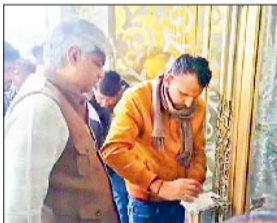
पानीपत। एंजेल प्राइम मॉल को सील करते हुए हुडा के अधिकारी।