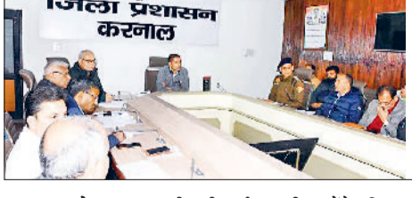
चयन आयोग द्वारा जारी की गई हिदायतों की दृढ़ता से अनुपालना सुनिश्चित की जाए। उन्होंने कहा कि हरियाणा कर्मचारी चयन आयोग सीईटी गुप सी की लिखित परीक्षाओं के लिए जिला में 33 परीक्षा केन्द्र बनाए गए हैं, जिनमें 9685 परीक्षार्थी