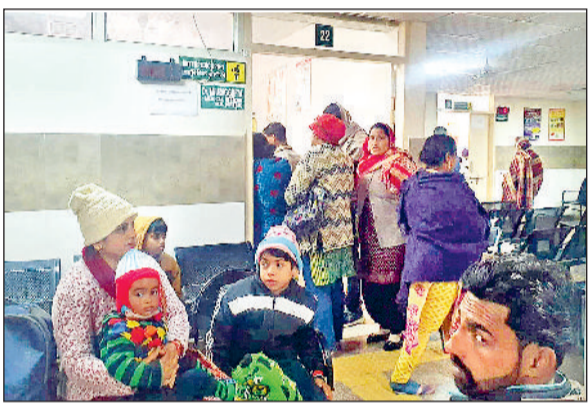
यमुनानगर। जिला नागरिक अस्पताल में ओपीडी में जांच कराते हुए मरीज।