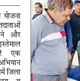
पानीपत। एसडी कॉलेज के विद्यार्थी नागरिकों को वोट बनवाने के प्रति जागरूक करते हुए।